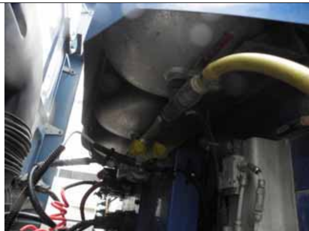
Rezervor de apa