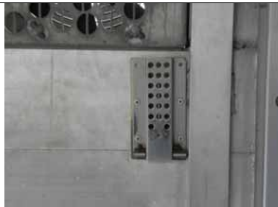
Senzor de temperatura