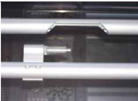
Vitei, porcine, caprine, ovine