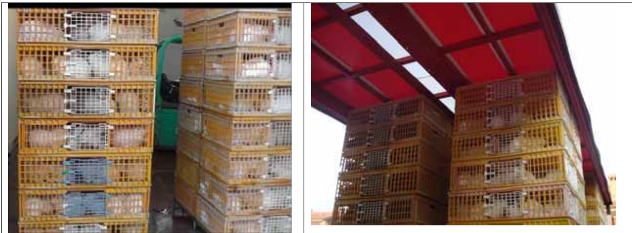
Containere transport iepuri