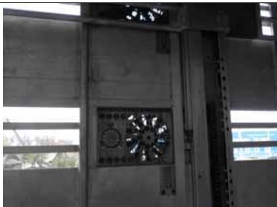
Senzori de temperatura