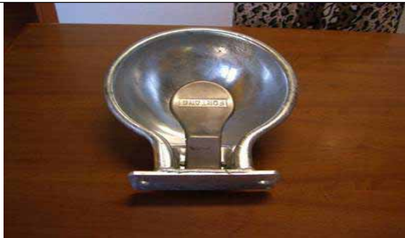
Bovine si cabaline (adulte si tineret)

Mai jos, sunt prezentate exemple de dispozitive de adapare recomandate pentru diferite specii: