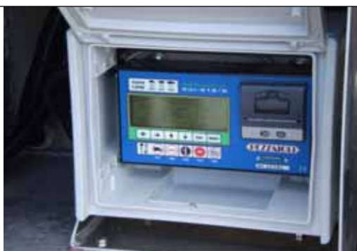
Sistem de monitorizare a temperaturii

Mijloacele de transport rutier trebuie sa fie echipate cu un sistem de monitorizare a temperaturii, precum si cu un mijloc de înregistrare a acestor date. Senzorii trebuie amplasati în interiorul camionului în zonele în care, în functie de caracteristicile de proiectare, pot înregistra cele mai aspre conditii climatice. Înregistrările temperaturilor astfel obtinute sunt datate si sunt puse la dispozitia autoritatii competente, la cererea acesteia.