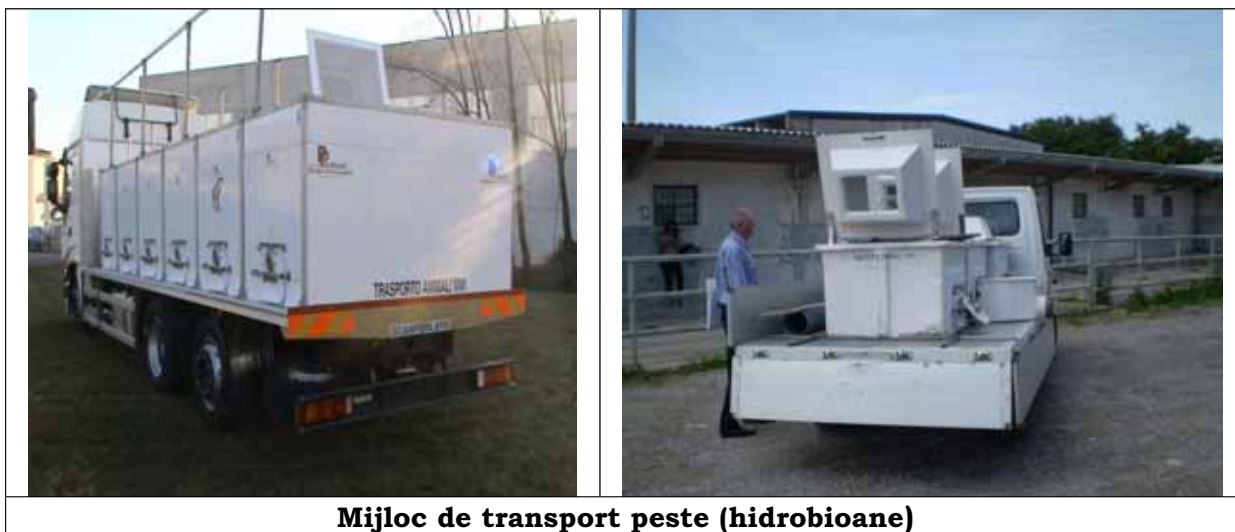
Mijloc de transport peste (hidrobioane)

Conditile de autorizare ale mijloacelor de transport destinate pestilor sunt precizate in Ord. ANSVSA nr. 16/2010, Anexa 42, modelul F cu modificarile si completarile ulterioare.