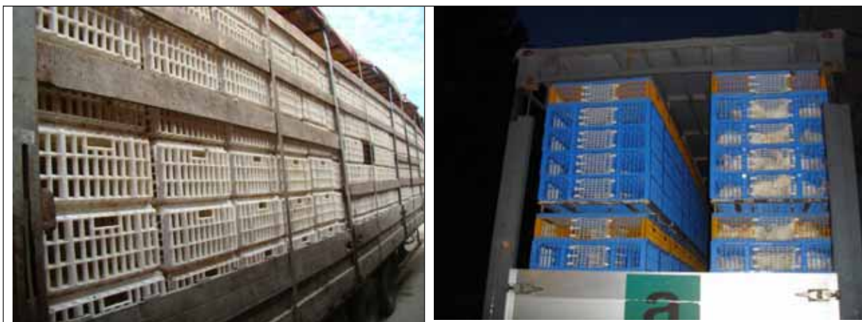
Containere transport pasari (exemple)

Pasarile nu se adapa și nu se furajeaza pe durata calatoriei.