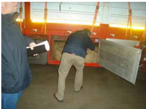
Spatiu depozitare hrana

Animalelor neintarcate trebuie sa li se asigure electroliti sau substituenti ai laptelui, inainte de imbarcare, precum si in timpul perioadelor obligatorii de repaus.