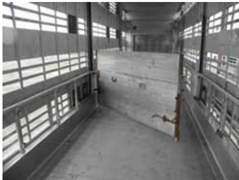
Perete despartitor – delimitare compartiment