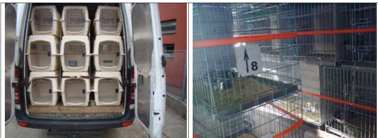
Mijloc de transport caini