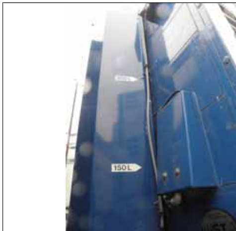
Indicator de nivel – rezervor de apa