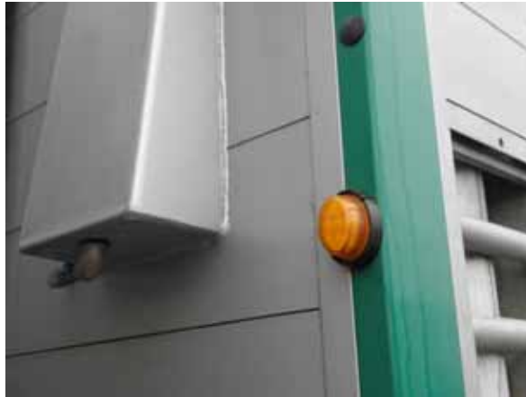
Sistem de avertizare vizual

Mijloacele de transport rutier trebuie sa fie echipate cu un sistem de alarma care sa alerteze conducatorul (vizual sau sonor) atunci când temperatura din compartimentele în care se afla animale atinge limita maxima sau minima.