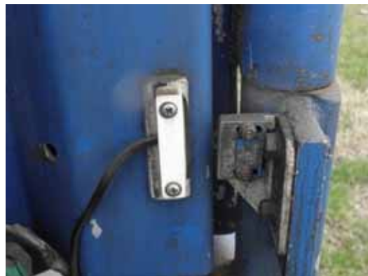
Senzor amplasat pe clapa de inchidere/deschidere

Mijloacele de transport rutier trebuie să fie echipate cu un sistem de navigatie adecvat, care să permită înregistrarea si furnizarea de informatii privind localizarea mijlocului de transport si referitoare la deschiderea/închiderea clapei de încărcare. Pentru inregistrarea datelor referitoare la utilizarea clapei de deschidere/închidere este necesara montarea unui senzor pe rampa de incarcare a vehiculului.